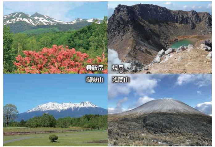
乗鞍岳 焼岳 御嶽山 浅間山