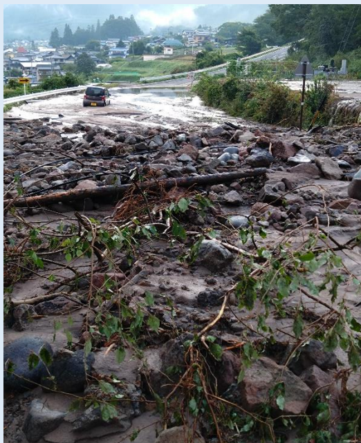
令和5年9月 真田町長地区土石流被害