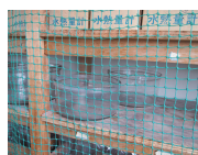
扉のない棚はネットで飛び出しを防ぐ